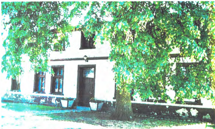
Dom przy ul. Starowiejskiej 15.