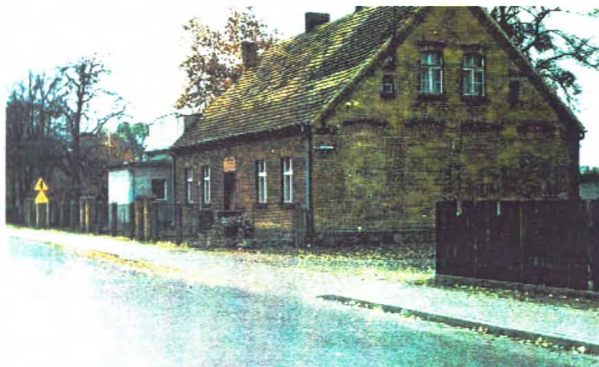
Stara szkoła (z tyłu widoczna tzw. „biała klasa”).