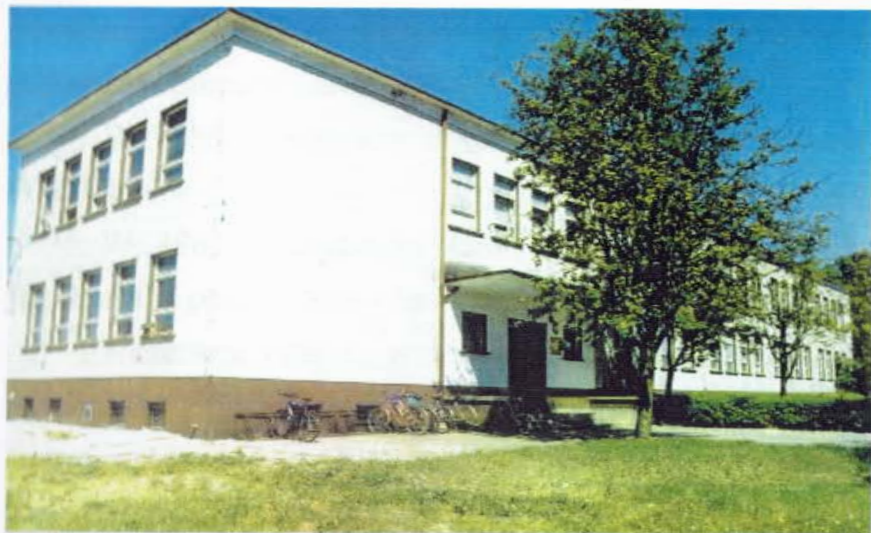
Nowa szkoła (obecnie podstawowa i gimnazjum).