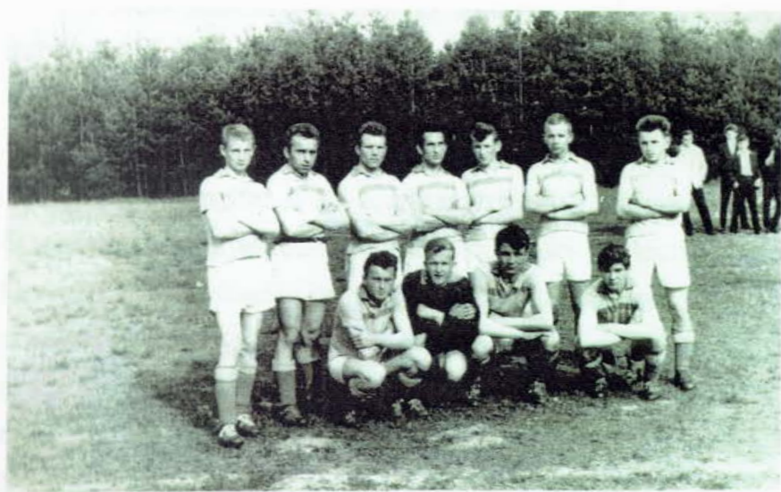
Sparta Orzechowo (zdjęcie z roku 1964).